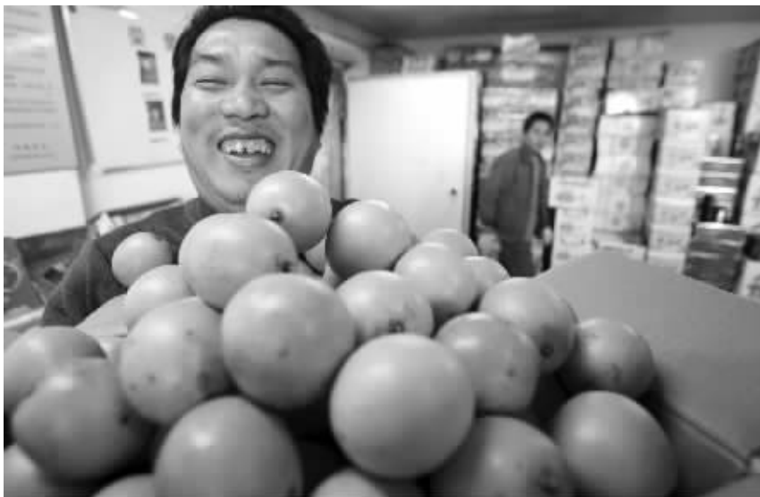
昨天,今年首批5万公斤台湾柳橙在南京上市