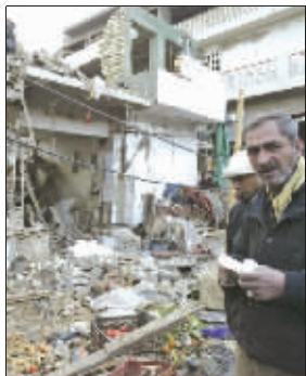
繁忙的市场被炸成了废墟

伊拉克首都巴格达市中心一个繁忙的市场3日发生汽车炸弹爆炸事件,造成至少132人死亡,305人受伤。这是今年以来伊拉克发生的伤亡最惨重的爆炸袭击事件。