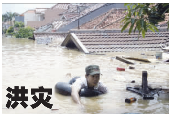
雅加达灾民在洪水中漂流

2月1日,伊南部城市希拉接连发生两起自杀式爆炸袭击事件,造成至少57人死亡、150人受伤。