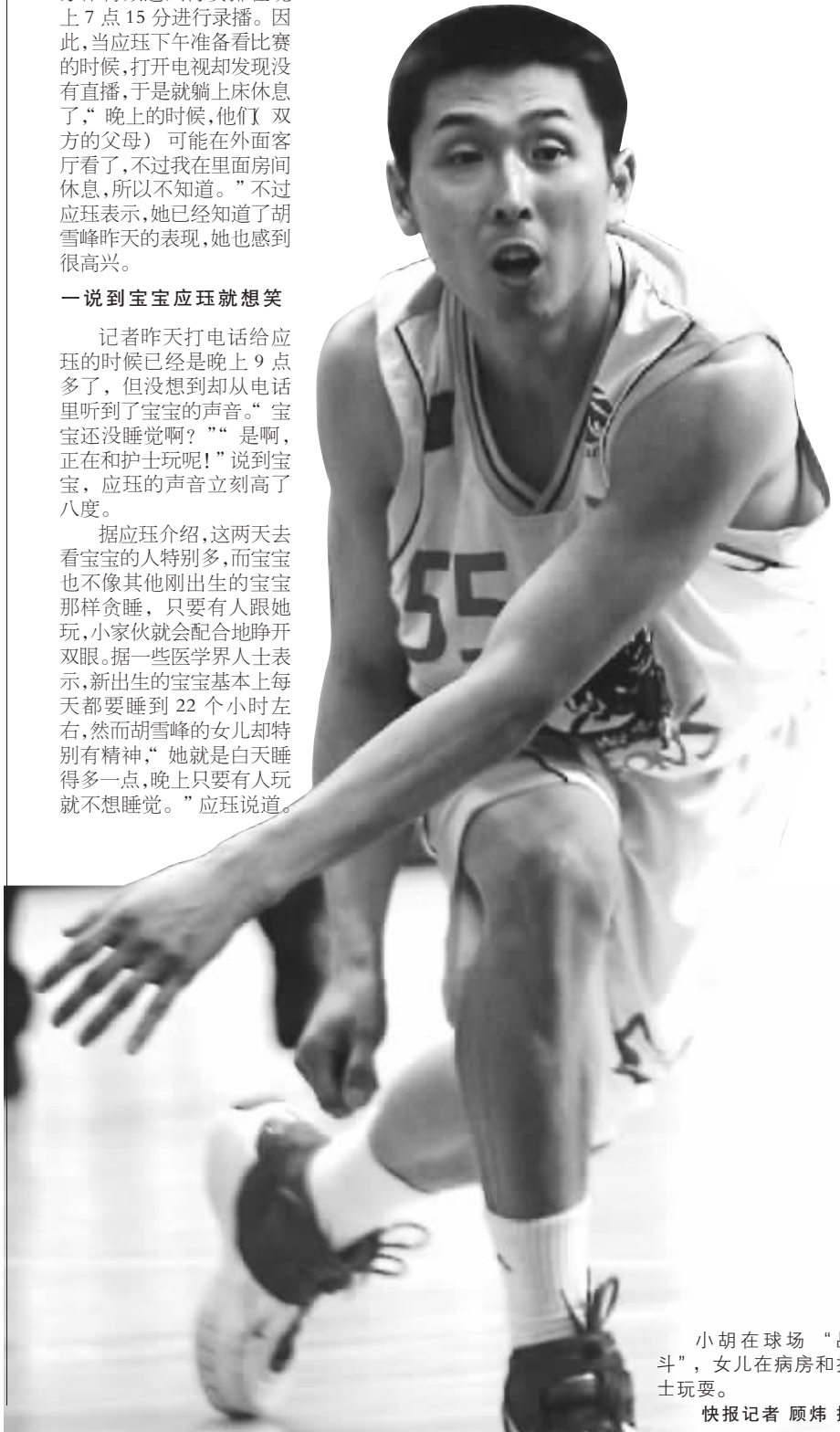
小胡在球场“战斗”,女儿在病房和护士玩耍。

昨天,广东队以111:88战胜吉林队,取得了常规赛的第一。在凯尔特人总经理面前,易建联拿到28分、10个篮板,表现相当不错。王文