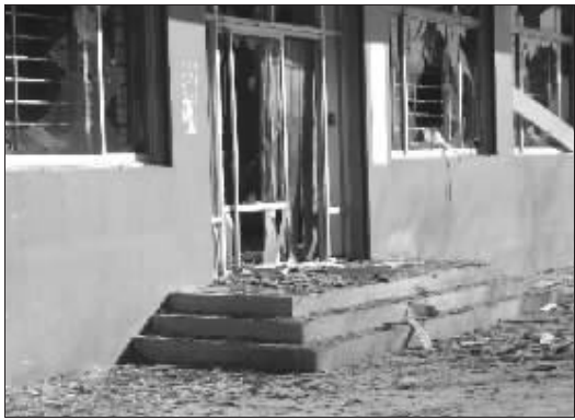
爆炸现场一片狼藉