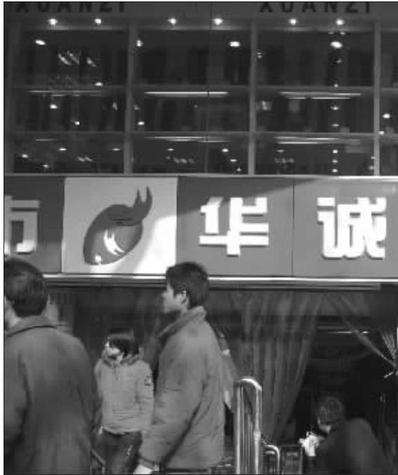
华诚超市的新标志让人议论纷纷