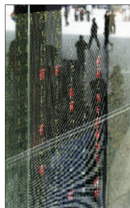
旅客从火车站售票大厅的液晶显示屏前走过。不涨价的消息对返乡者来说无疑是重大利好。