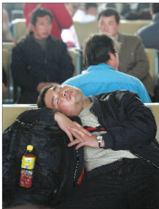
睡着了,做着回家的梦。