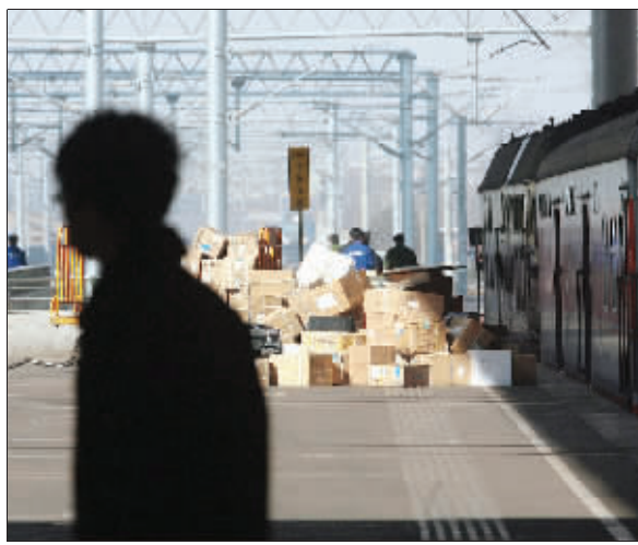
站台工作人员正在搬运行李,火车站迎来了繁忙时刻。

顺着铁路,就走到了家, 像一根根丝带,牵着心底的思念。 春天快来的时候,就开始张罗着返乡车票, 踏上火车的那一刻, 就已经看到了站在门口的爸妈。