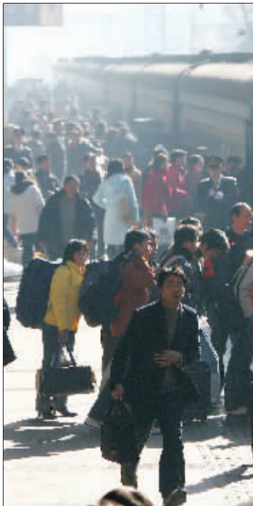
火车站站台上人潮汹涌,民工、学生赶着春运踏上回家路。