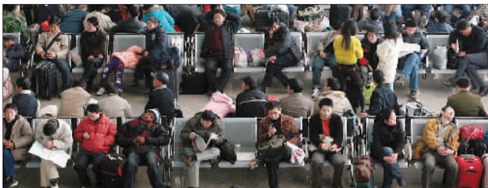
候车厅里的人们神态各异。一年一度的大迁徙对许多人来说已经习以为常。