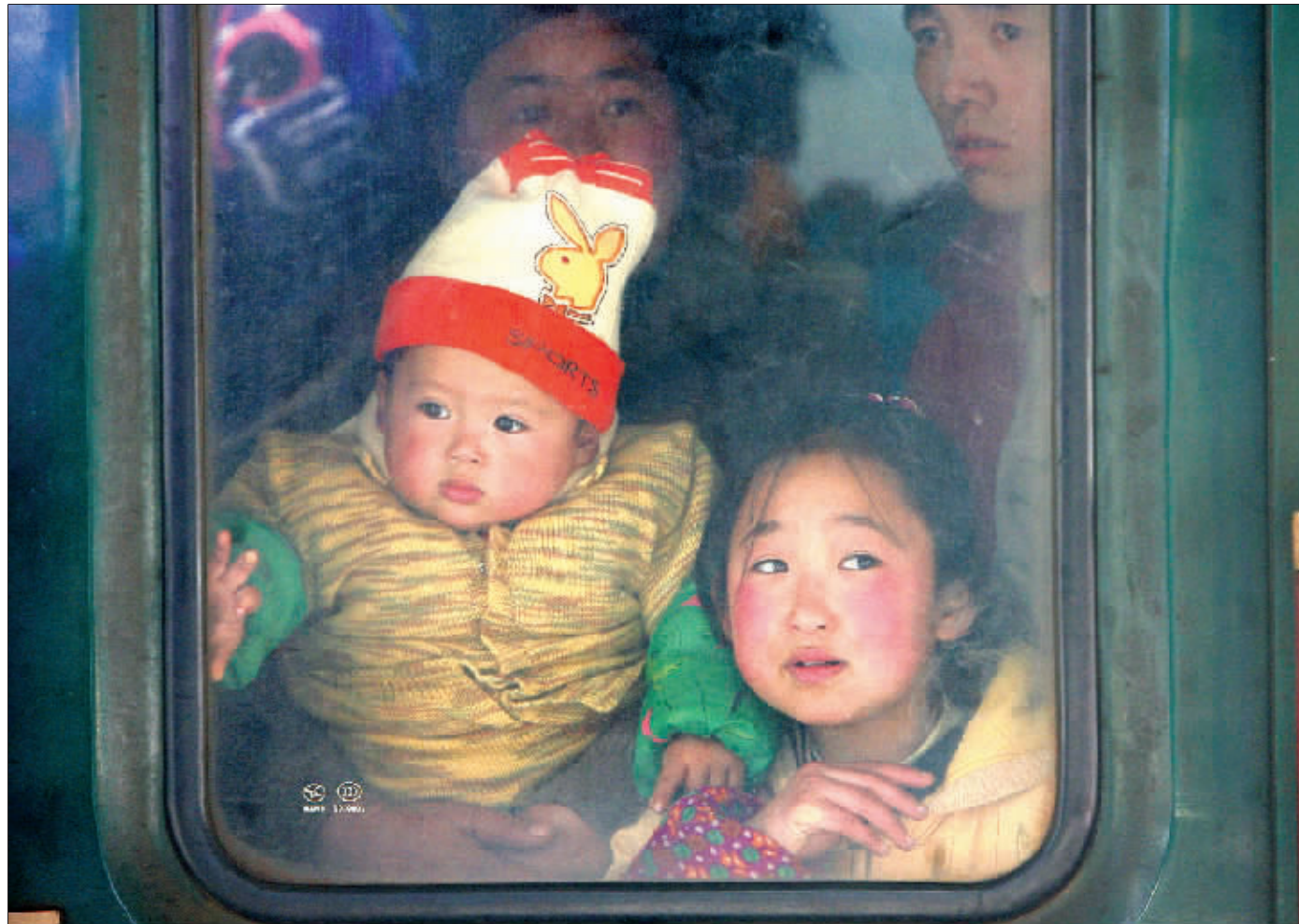
两个孩子透过火车车窗向外张望。春运第一天,11万人踏上回家路。