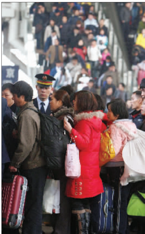
排队上车的人群井然有序。