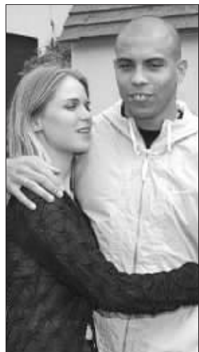
罗纳尔多和苏珊娜旧情复燃? 资料图片