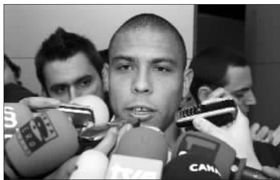
罗纳尔多向记者确认皇马与AC米兰达成协议同意他去意大利