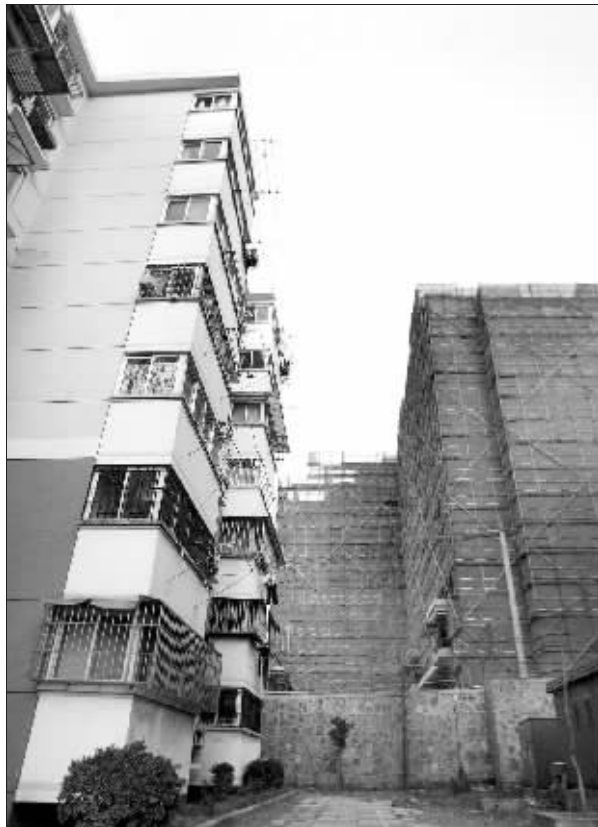
由于旁边新房的影响,南京樱海公寓4栋的日照时间受到影响。