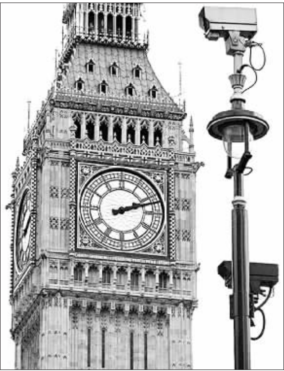
伦敦大本钟附近的灯柱设有多个闭路电视

由于X光摄影机会拍下民众的裸体照片,行人走在街上形同赤身露体,因此有关官员建议说,只由女职员负责监察女性对象。不过,对街头上人头攒动的情况,他们也承认要实行此法“非常困难”。