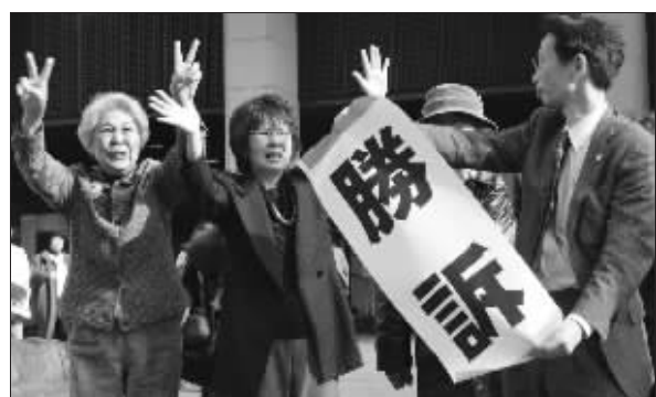
1月29日,“VAWW-NET”成员和律师庆祝赢得官司