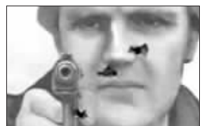
训练中心被打三枪的靶标

不过,“勇士”和利特维年科早在几年前就已经结仇:利特维年科曾点名批评“勇士”参与黑帮火拼。 邱永峰