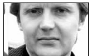
利特维年科资料照片