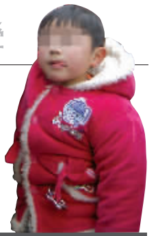
4岁哑女 被扔在医院 详见 B5 版