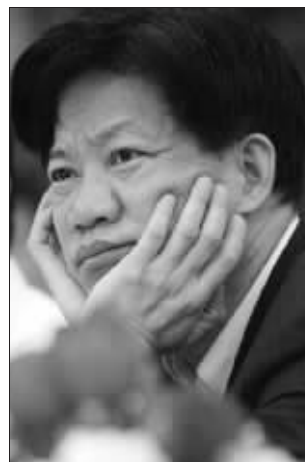
国家药监局原局长郑筱萸(资料图片)

机制。加快转变政府职能,认真贯彻执行行政许可法,继续深化行政审批制度改革。完善审批运行机制,做到分工合理、职责清晰、相互制约、相互监督。推进行政审批公开,实行“阳光”透明审批。三要抓好领导干部廉洁自律教育,加强干部队伍建设。各级领导干部要带头执行好中央关于党政干部廉洁自律的各项规定。对机关干部特别是行政执法部门的干部要严格要求、严格教育、严格管理、严格监督,不断提高队伍整体素质。