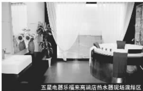
五星电器乐福来高端店热水器现场演绎区

“为了迎接马上到来的春节大假,我们的促销方式已经出台。”五星电器总部负责人透露,今年春节促销活动的启动点定在本周六,五星电器通过提前促销的方式来抢占市场先机。据了解,周六五星