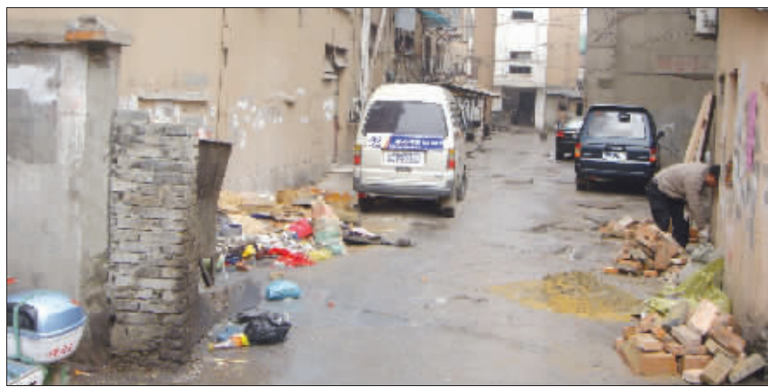
小区不再像以往一样井然有序