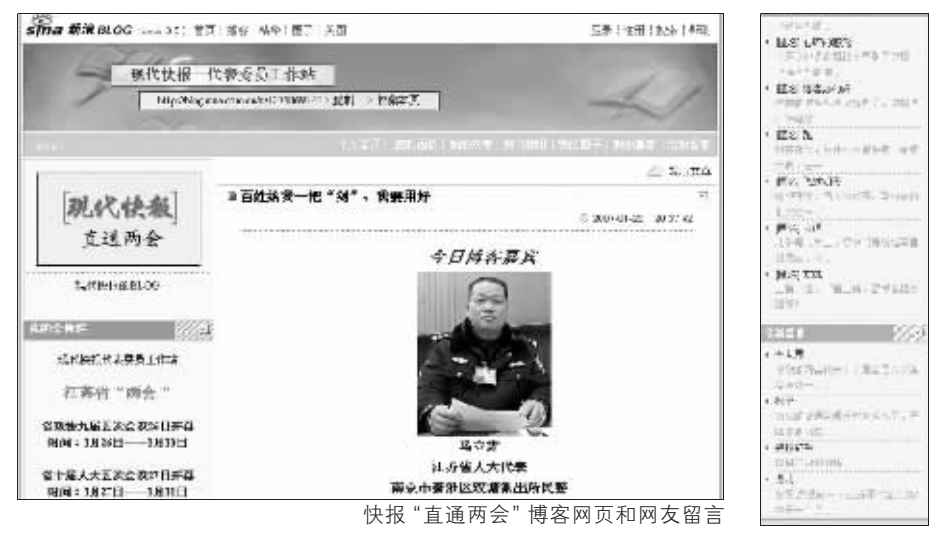
快报“直通两会”博客网页和网友留言

江苏省“两会”临近,快报“直通两会”博客和“人大代表政协委员工作站”的读者越来越凸现,党委、政府越发重视政协工作,委员们的文化素质、参政议政能力也普遍提高,老百姓也越来越多地找委员反映情况、提出建议。