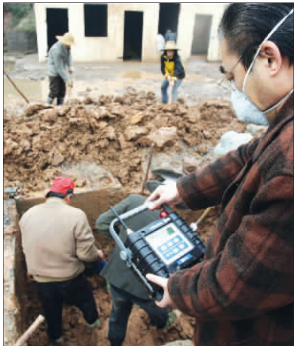
一名环境监测人员正在用仪器监测井口的空气

记者 22 日凌晨从重庆市双桥区了解到,该区通桥镇一旧温泉井被发现不明气体溢出后,马上疏散转移了周边居民,目前没有人员伤亡。