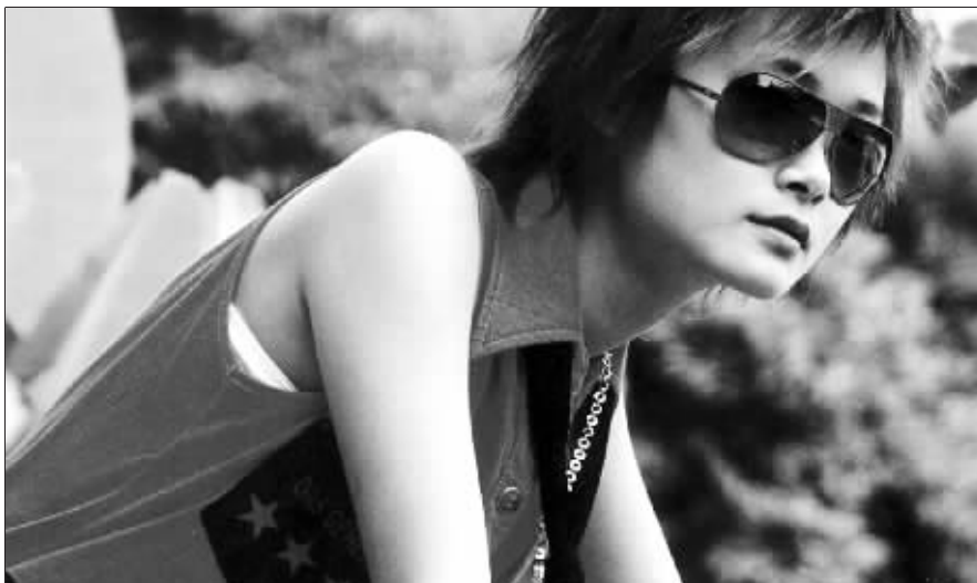
李宇春方面觉得此事很无聊