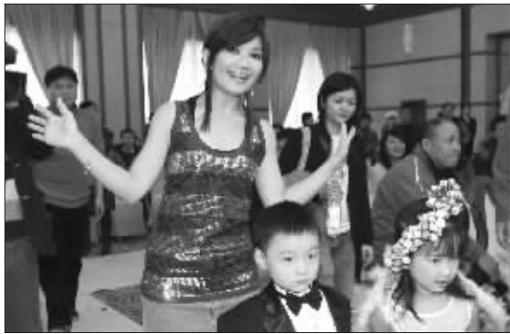
梁静茹的这场发布会别出心裁

洁白地毯、粉红布幔、罗马灯柱……“情歌天后”梁静茹在花童的引领下缓缓走入礼堂。这是静茹为“Tesiro 通灵钻石之夜·爱的大游行亲亲演唱会”，昨日在宁举行的别出心裁的新闻发布会。2月14日情人节，梁静茹将唱着情歌，与南京的情侣们一同度过，这又是静茹生命中一个没有情人的情人节。