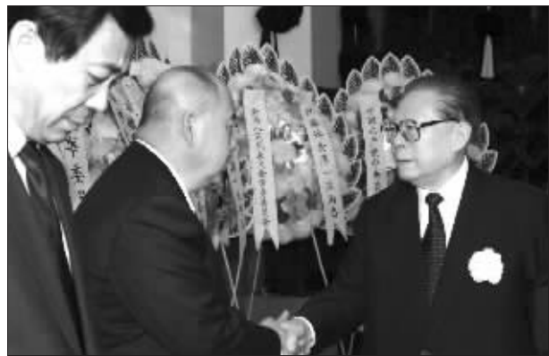
江泽民同薄一波亲属握手，表示深切慰问