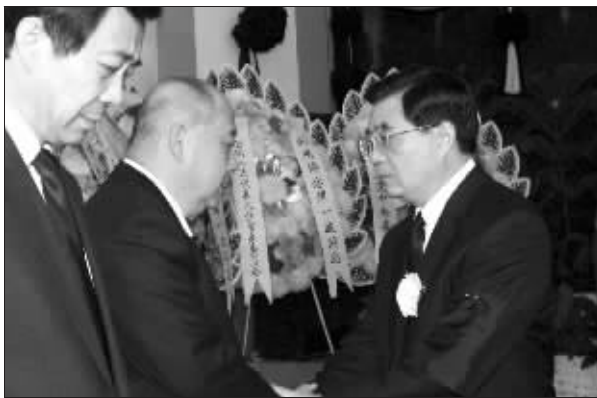
胡锦涛同薄一波亲属握手，表示深切慰问

薄一波同志病重期间和逝世后，前往医院看望或以各种形式向其亲属表示慰问的还有：王乐泉、张立昌、张德江、李鹏、乔石、朱基、宋平、刘华清、李铁映、丁石孙、许嘉璐、傅铁山、廖晖、阿沛·阿旺晋美、帕巴拉·格列朗杰、张思卿、丁光训、马万祺、张克辉、董建华、张榕明和李德生、肖克、张劲夫、黄华、彭冲、王芳、谷牧、吕正操、杨白冰、田纪云、姜春云、钱其琛、张震、倪志福、陈慕华、孙起孟、雷洁琼、李锡铭、王丙乾、邹家华、吴阶平、周光召、曹志、韩杼滨、吴学谦、钱学森、董寅初、叶选平、杨汝岱、钱伟长、宋健、朱光亚、赵南起、毛致用、经叔平、王文元、张廷发、韩光、中央军委委员梁光烈、廖锡龙、陈炳德，以及于永波、王瑞林，香港特别行政区行政长官曾荫权、澳门特别行政区行政长官何厚铨等。