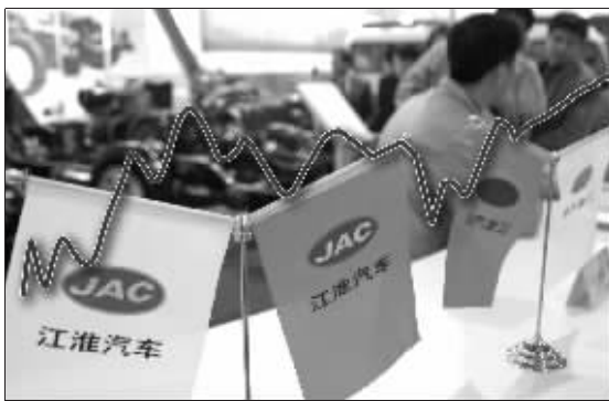
个股再现普涨,上证综指昨日收复2800点 制图 郭晨凯

从多空局势分析,尽管由于目前市场资金面较为充裕,导致股指在调整之后在买盘的推动下再度出现强劲回升,但并不意味着多方取得了绝对的优势。总体而言,由于新年以来两市在相对高位堆积了近万亿的筹码,而指数更是剧烈震荡,表明投资者的心态已经比较浮躁,因此,消息面的种种传闻都可能导致大盘剧烈波动。分析人士指出,短线来看是否加息将成为影响行情的关键因素,大盘后市可能维持高位剧烈震荡反复,以等待消息面进一步明朗再选择方向。