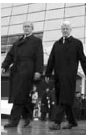
2004年11月,克林顿图书馆开张,布什(左)到场祝贺

除了选址外,建图书馆需要总统自己筹款,政府并不出钱。对布什来说,共和党内大款云集,钱恐怕不成问题,但要想出别出心裁的创意就需要他费一番心思了。前总统肯尼迪的图书馆由著名华裔设计师贝聿铭设计,成为建筑史上的经典。克林顿图书馆则利用小石城一片临河的铁路车站旧址,体现了他环保和为民的思想,也很有特色。 陈笛