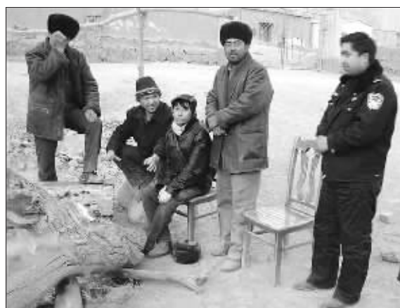
在库斯拉甫四周的村庄, 维族老乡和警察在关卡上全天候值守, 堵截逃窜的恐怖分子

“从2004年下半年开始, ‘东突’势力在新疆境内的恐怖暴力活动又有抬头趋势。”一位研究者透露说。