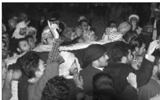
班达尔的支持者为他举行葬礼

然而,这位一生绞人无数的大师级“刽子手”对自己的职业似乎并没有多少认同感。他于 1956 年辞职后写道:“在我看来,死刑只能起到报复的目的。”陈笛