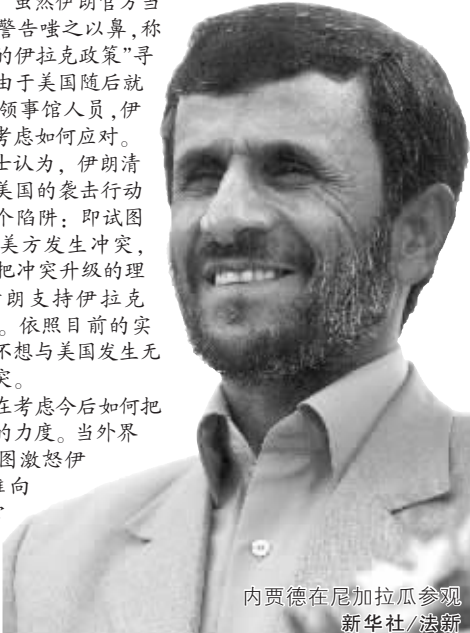
内贾德在尼加拉瓜参观