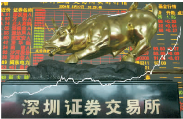
今年以来深强沪弱明显，图为深成指走势。制图 沈明

国泰君安证券研究所近日进行的一项问卷调查结果显示，绝大多数机构仍然对股市行情充满信心，七成多的被调查者认为，2007 年上半年大盘指数将继续上涨，而近半数的被调查机构目前仓位超过 80%。