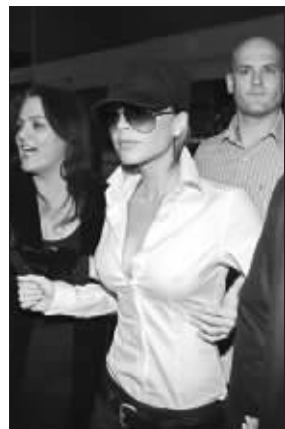
辣妹被人“架”出机场

2.5亿美元的天价跟洛杉矶银河队签下5年合约,预计,贝克汉姆在8月正式加入银河队。而洛杉矶也将热切迎接多金的贝克汉姆夫妇。(辛闻)