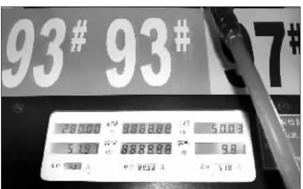
14日起93号汽油每升降价0.18元