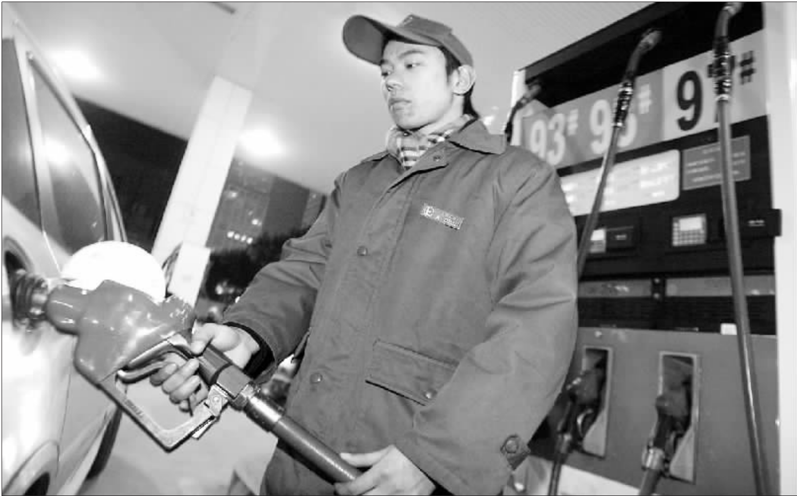
和以往每次油价上涨所表现出的积极相比,面对此次降价,加油站显示出冷漠。

汽油价格开始上调,南京市90号高标准清洁汽油零售中准价每吨由4245元上调到4545元。