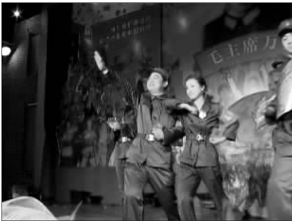
一对男女身着红卫兵服装摆着 Pose

鲜艳的红五角星,硕大光亮的毛主席像章,充满上世纪六十年代色彩的革命标语和毛泽东语录,身着红卫兵服装的服务员,宴会中红色经典歌曲和样板戏选段……前晚,南京地铁1号线中胜站对面,一家名为“火红岁月”的餐厅正在举行一场与众不同的“红色”婚宴。