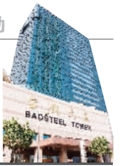
钢铁股再度集体展露锋芒成为市场关注焦点。是谁推动了大炼钢铁的行情? 详见 A28 版