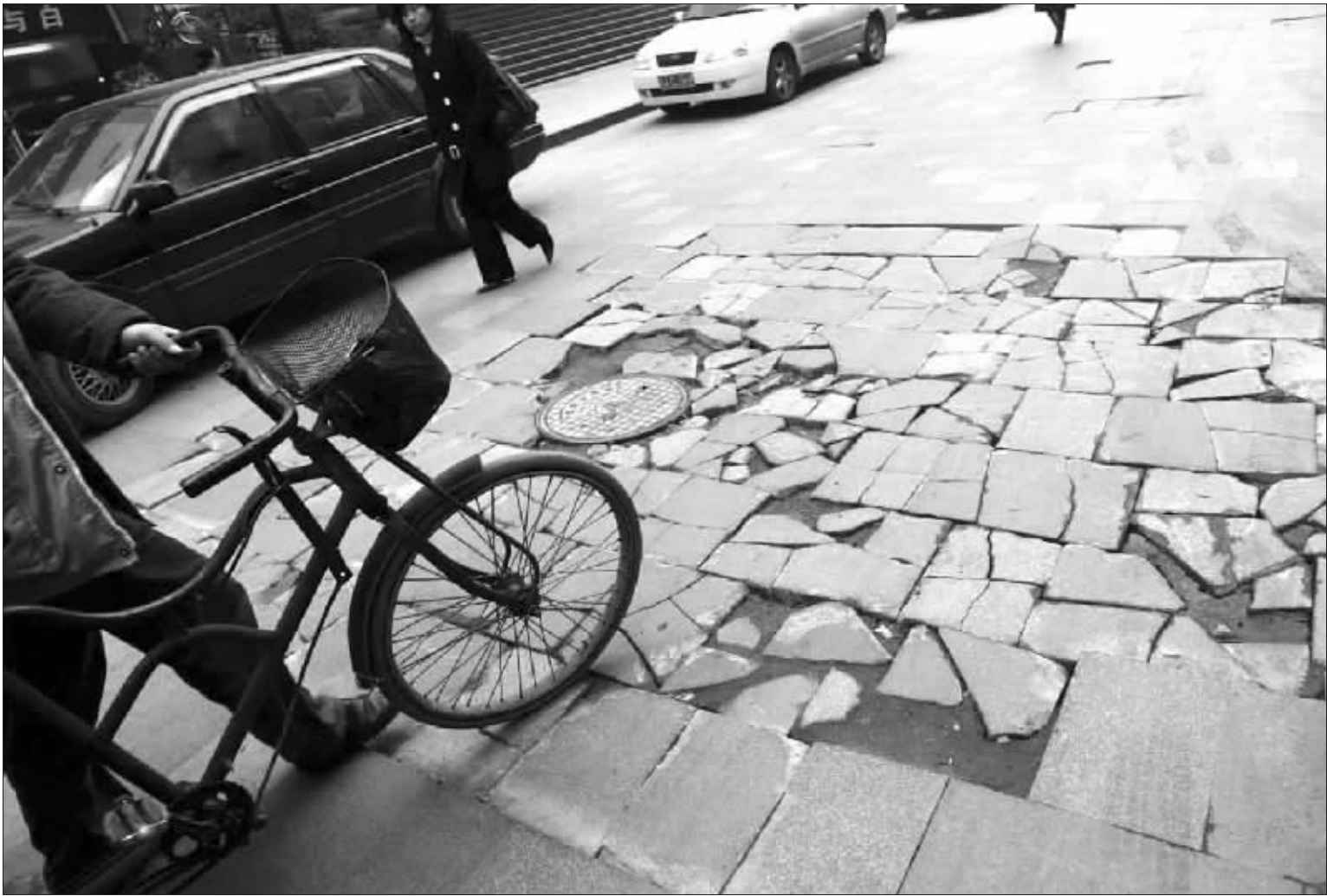
南京新街口金贸里的大理石路面被过往车辆碾轧得坑坑洼洼