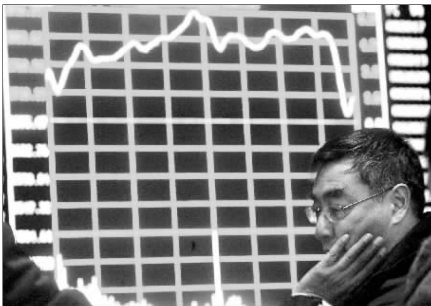
昨天,一名股民在南京一家证券交易大厅的大屏幕前思索。

新华社上海1月4日专电(记者潘清江国成)2007年第一个交易日,中国股市喜现“开门红”:上证综指不仅稳稳地站上2700点关口,盘中更攀上2800点,以2847.61点再创历史新高。深市也再度改写新高纪录。与此同时,两市创下超过1200亿元的成交“天量”。