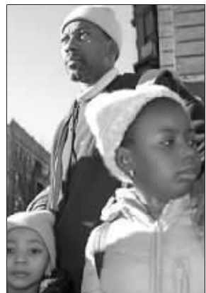
救人英雄奥特里和他的俩女儿