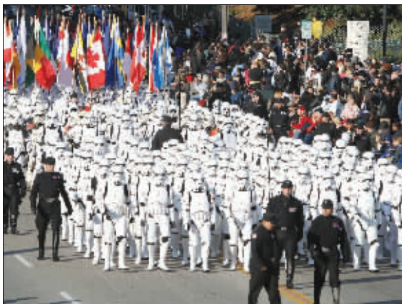
《星球大战》影迷扮成“风暴战士”