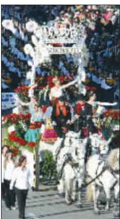
▲“玫瑰皇后”和“玫瑰公主”乘坐花车 ▶好莱坞著名导演乔治·卢卡斯和女儿阿曼达乘坐花车招摇过市