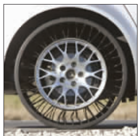
法国米其林公司研制的无气车轮

为了减少驻伊拉克美军的伤亡,五角大楼出重金资助一家美国公司研制不用充气的轮胎。这样即使悍马车遇到炸弹袭击,照样能迅速脱离险境。