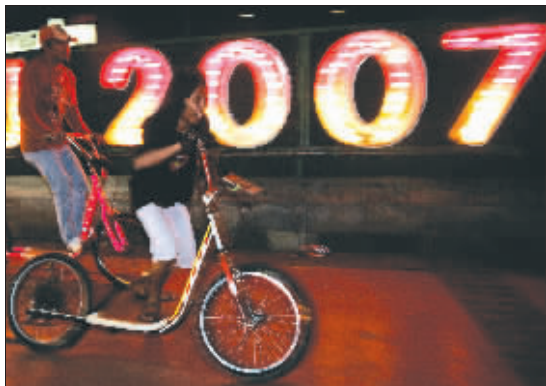
印尼首都雅加达街头2007形状的灯饰