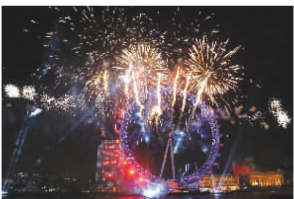
伦敦著名的“伦敦眼”上空焰火绽放

据日本厚生劳动省1日公布的数据,2006年,日本新生儿108.6万,比2005年增加了2.3万。