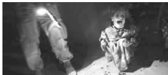
美军士兵进入伊拉克一间民宅搜捕,小女孩被吓得大哭

□据新华社电 目前,国际社会和舆论比较容易形成一致的看法就是:处决萨达姆依然难解伊拉克当前的乱局,而且很可能会使伊拉克局势雪上加霜。