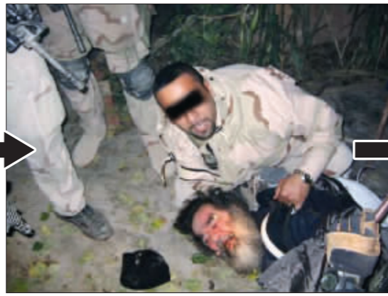
被捕 这是2003年12月13日,萨达姆在其家乡提克里特附近被美军抓获的资料照片。