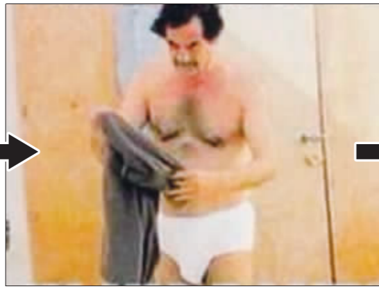
囚犯 媒体曝光的几张萨达姆在关押期间的照片。在照片上,萨达姆只穿着内裤。