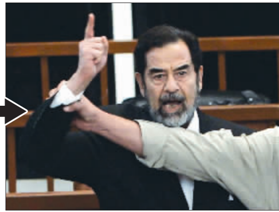
受审 这是2006年11月5日,萨达姆在巴格达的法庭上大声抗议的资料照片。