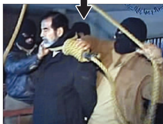
绞死 12月30日,伊拉克电视台证实,伊拉克前总统萨达姆·侯赛因已经被处以绞刑。这是萨达姆被处以绞刑的电视照片。

“伊拉克前总统萨达姆·侯赛因当地时间30日早晨6时零5分(北京时间上午11时零5分)被处死刑。” 从2003年底被捕,到2006年底被绞死,萨达姆经历了3年牢笼和庭审。以下是其间大事回放。