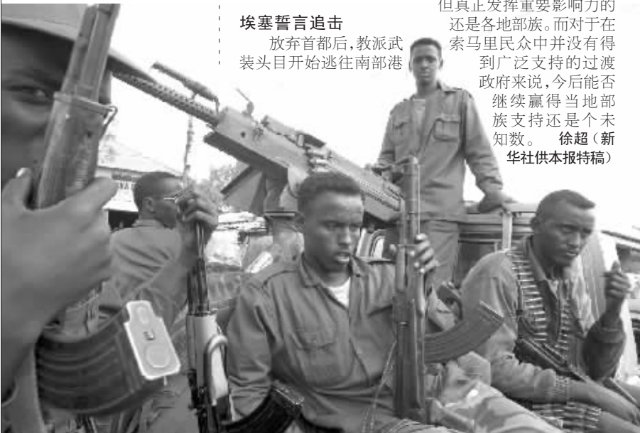
29日,几名索马里过渡政府士兵在首都摩加迪沙街头巡逻