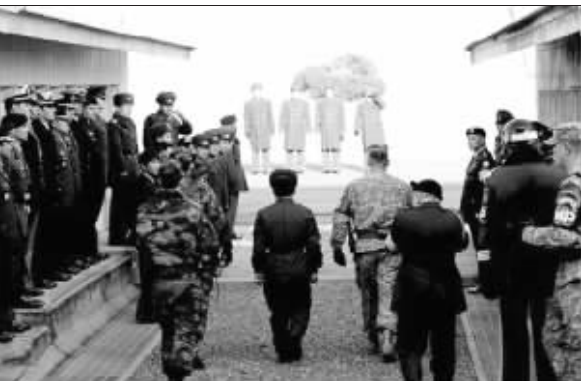
27日,获救朝鲜士兵通过板门店被送回朝鲜

虽然教派武装此前占据了索马里大部分地区,但真正发挥重要影响力的还是各地部族。而对于在索马里民众中并没有得到广泛支持的过渡政府来说,今后能否继续赢得当地部族支持还是个未知数。徐超(新华社供本报特稿)