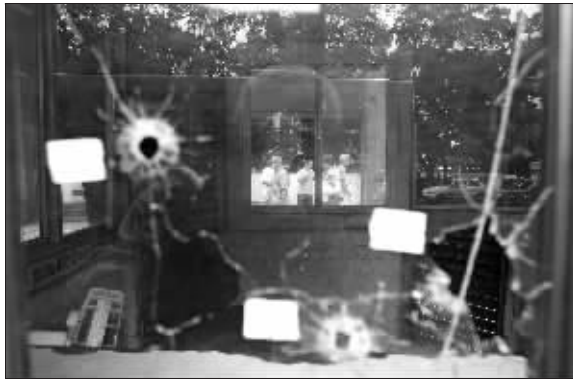
28日,巴西里约热内卢一个警察哨所被袭后一片狼藉

“首都第一司令部”在里约热内卢活动并不活跃,但当地一些毒品犯罪团伙与之有关联。傅云威(新华社供本报特稿)