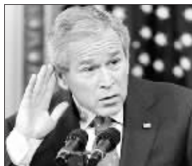
布什日前在新闻发布会上

像布什这样既被某些民众爱到极又被另一部分人恨到极点的现任总统,在美国历任总统中很难找到。在最新的一次民意调查中,布什奇特地在两个极端上得票率最高,从而成为了美国人心中2006年最坏的人和最好的人。