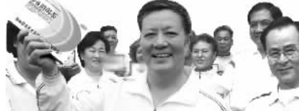
病友激动地说:有了糖尿病百元康复工程,有了私人医生,糖尿病再也不可怕了!

不仅如此,百元康复工程的私人医生还耐心给患者提供用药、饮食等方面指导。加入百元康复工程的糖尿病患者欣喜地说:“血糖降了,并发症好转了,生活质量提高了,叫我们怎能不高兴!”