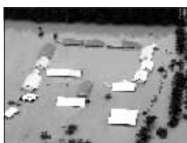
被洪水淹没的学校

马来西亚受灾最严重的地区是南部的柔佛州,总共有大约7万人被迫逃离家园,马六甲和彭亨州分别有1万和6000人无家可归,洪水造成至少6人死亡。王丰丰(新华社供本报特稿)