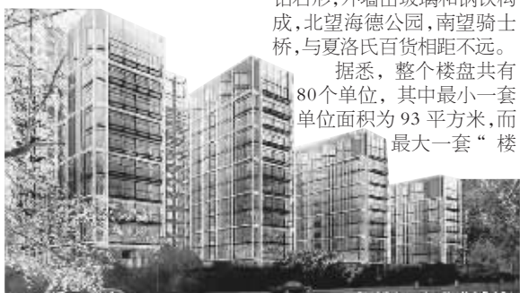
“海德公园一号”规划图

王”单位不仅可以180度饱览海德公园的“无敌景观”,其面积则达到惊人的1858平方米!