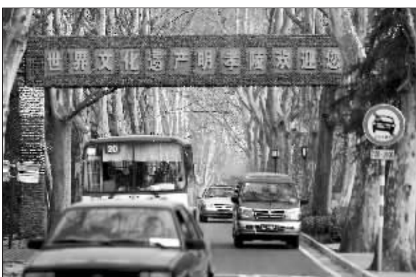
巨大的车流已让中山陵景区不堪重负

规划:五处设卡收费 禁车、限车,已成为南京不少市民和文物工作者的强烈呼声,而中山陵也委托南京交通规划设计研究所着手规划全新的交通组织,核心就是景区限车。“现在初步构想是通过收费的方式,利用经济杠杆来限制车流。”规划方告诉记者,设置交通管制点并不是强制要求车辆不能“借道”,但要收取一定费用,这对每天从此通过的