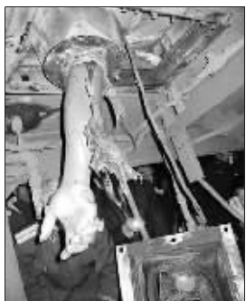
乘客手臂被便坑卡住

12月18日,在武昌开往深圳的T175次列车上,一乘客从厕所里捞手机时,手臂被便坑卡住。经车上、车下8小时协力营救,方才脱险。此事造成列车晚点近5小时。