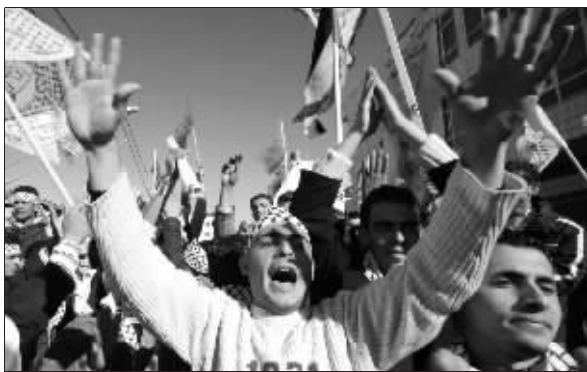
法塔赫的支持者在游行

法塔赫和哈马斯武装人员19日在加沙多处地点爆发枪战,造成3人死亡、10多人受伤。路透社援引目击者的话说,冲突最早发生在位于加沙城的希法医院。当时,从属于哈马斯的警察部队试图在医院门口逮捕数名法塔赫成员,理由是这些人涉嫌参与不久前前的两派冲突。两派别随后爆发枪战。整个枪战持续约1小时。由于当时正值上学时间,许多前往学校的学生在听到枪声后慌忙寻找躲避场所。枪战造成1人死亡、11人受伤,其中1人伤势严重。