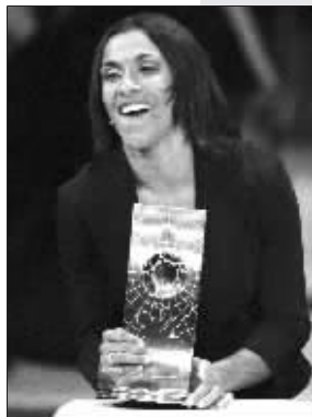
▲世界足球先生卡纳瓦罗。 ▲世界足球小姐玛塔。 ▼齐达内和罗纳尔多窃窃私语。

波塔依然坚持认为“小罗才是世界上最好的球员”,但出现在发布会现场的小罗却对卡纳瓦罗获奖给予了肯定,并表示在即将过去的一年中自己已经尽了力。他说:“卡纳瓦罗是世界上最好的后卫,这一点毋庸置疑。至于我,每年都会竭尽自己所能去帮助我的球队,只有这样才能有机会来到这里(苏黎世)。我已经尽了力,重要的是作为球员我希望能参加所有重要的比赛并希望通过比赛为大家带来快乐。”(新文)