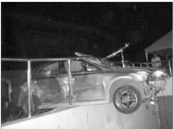
马自达轿车“挂”在护栏上