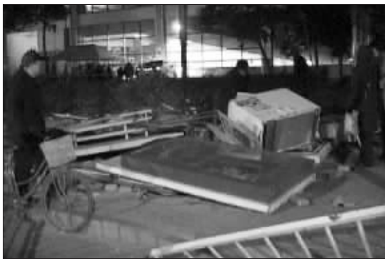
路边报亭被撞成废墟