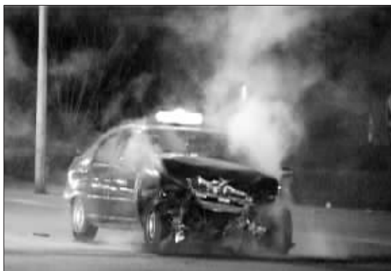
出租车车头被撞烂