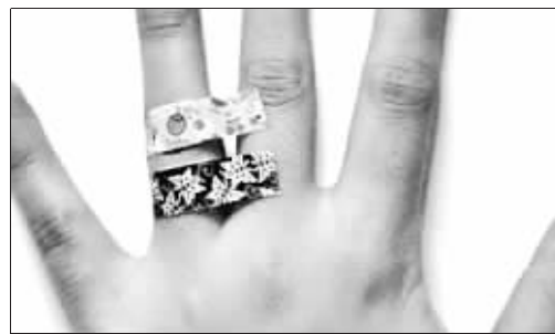
卡通创可贴也不乏花朵图案(资料图片)

“这创可贴就是贴着玩的,看看,这个维尼熊是不是很像?”前天,记者在公交车上看到,一位女同学举起左手,向同伴展示她无名指上的卡通创可贴。出于好奇,记者顺着女孩提供的线索,在湖南路的一家小铺发现了这样的创可贴。