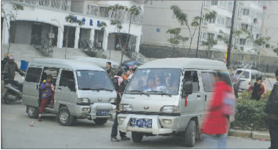
图为放学时学生拥挤着上了校门口无营运资格的面包车 快报记者 吴宏 摄

才多起来,平均每天有9辆车来接送学生。家长以包月形式包车,在同一村庄的孩子由固定的车辆接送孩子。“校门口的所有小中巴、面包车均与学校无关,是家长自发租赁的车辆。”杨校长说,他也很担心自己的学生在上学、放学途中的安全,也害怕万一行车途中出现事故,学校无法脱责。