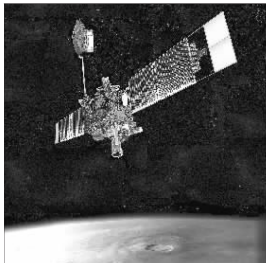
美国国家航空和航天局(NASA)10年前发射的“环火星勘测者”号探测器环绕火星运行时照片。

得联络。非常诡异的是,在它突然消失之前,刚拍到最新的火星“水流”情景,还准备对它做进一步的研究,有科学家为此开玩笑说:“火星人不高兴了,掳走了它。”稍早前,在火星地表工作已经有两年的“机遇”号和“勇气”号探测器也遭遇无法理解的现象,其中一台探测器表面“像是被人研究,擦过一样”,科学家无法解释这样的现象。邱文