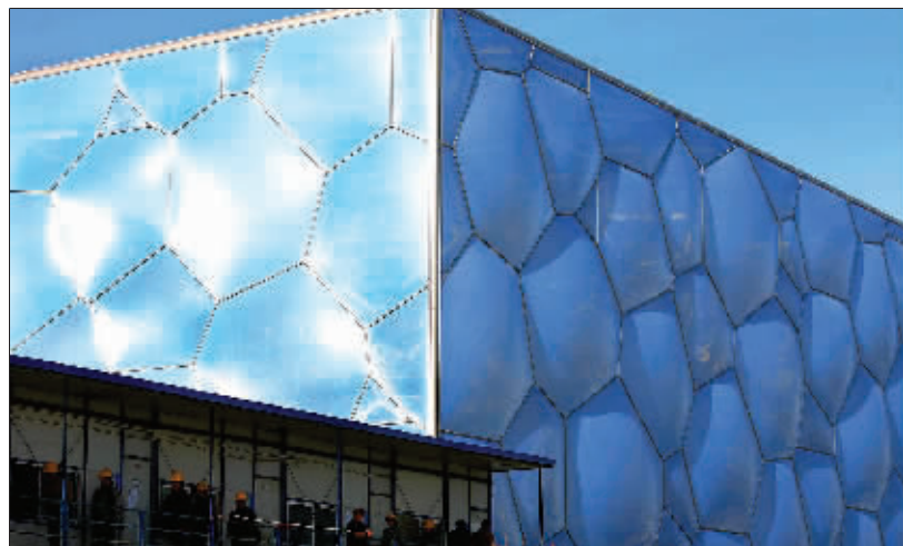
“水立方”首次向媒体公开亮相

在灿烂冬日的照耀下,俗称“水立方”的国家游泳中心吐着浅蓝色的“气泡”,向外界展示着梦幻般的“骄颜”。昨天11时左右,现已完成主钢结构施工的水立方首次向近百名中外记者公开亮相。在施工现场有关负责人向记者披露了之前不为人知的“水立方”的“秘密”。水立方建筑面积接近8万平方米,是一个170米×170米的立方体。整个水立方共有3000多气枕,是一种较好的节能方式。无论是屋顶还是墙面都设计了两层的气膜,声、光、热的环境都比较好。