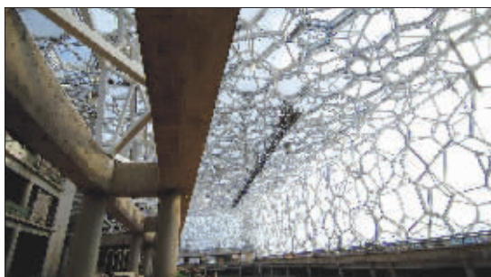
国家游泳中心内景

符”组成的连续空间,其间的4个车站,就是“乐谱中的休止符”。4座车站将分别以四季为主题,熊猫环岛站以红色加黑色为主色调,代表夏季的激情;奥体中心站则取黄色,代表辉煌,对应秋季;奥林匹克公园站的蓝色代表宽广和冬季;而森林公园站自然迎合了绿色的春季,代表希望。