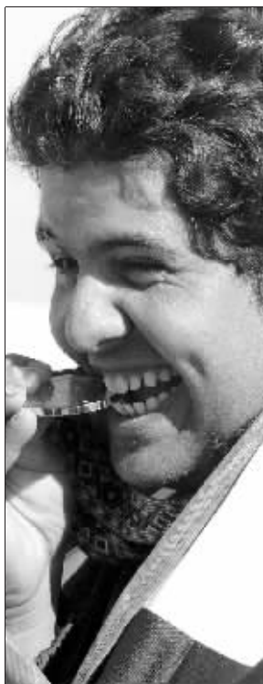
金牌的味道真好