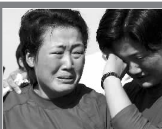
在亚运会赛艇女子四人单桨无舵手决赛中,韩国队意外失金,上岸后姑娘们抱头痛哭。

尔人即便不干活,当地政府每个月也会发给他们一人7000美金的生活费。 亚运会赛场,大家关心的不仅仅是金牌,更关心这些金牌为国家带来荣誉的同时,还能为各人带来多少经济收益。采访中记者了解到,对于不少亚洲国家来说,亚运会就是他们展示自己最好的舞台,因为奥运会的竞争太强,也太遥远。所以很多国家都更看重亚运会,也为亚运金牌开出了不菲的价码。