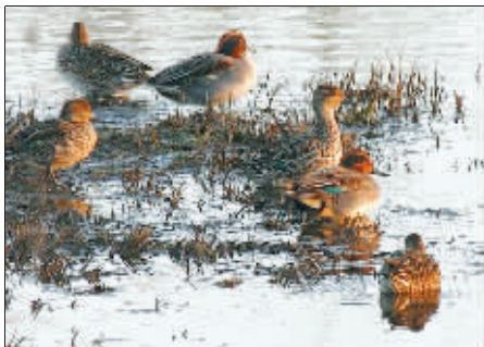
雄绿翅鸭绚丽的羽毛看上去像鸳鸯