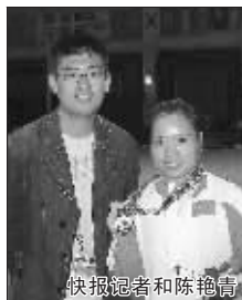
快报记者和陈艳青

恢复训练,陈艳青用了6个月;举起杠铃,陈艳青用了3秒钟;打破世界纪录,陈艳青用了1小时35分钟……这就是陈艳青从备战亚运会,到夺得多哈亚运会女子58公斤级冠军的真实写照。 抓举111公斤,挺举140公斤,总成绩251公斤,陈艳青打破三项世界纪录,她不仅成为江苏体育健儿第一个在多哈染指金牌的运动员,也是中国代表团第一个在亚运会上打破世界纪录的运动员。