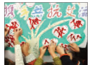
昨天，北京东路小学开展“童心红丝带同伴教育”活动。