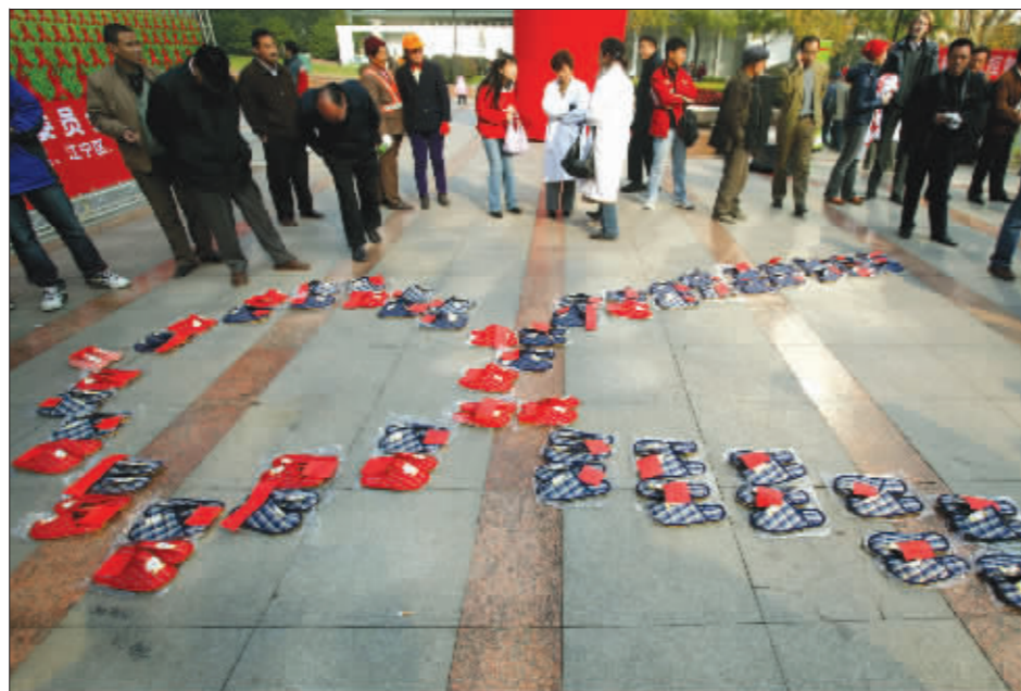
昨天在鼓楼广场，留学生们用65双拖鞋，拼成了艾滋病防治的国际性标志“红丝带”，象征中国约有65万名艾滋病感染者。

今天是第19个“世界艾滋病日”，昨天上午，南京市防治艾滋病知识进社区巡回展启动仪式在鼓楼广场举行。相关数据显示，南京“艾”情逐年上升，女性感染者比例增多。而在活动现场，不少市民拿着材料就走，害怕引起误会不好意思咨询；部分有“恐艾症”的市民，难以解开心头的“结”，竟然认为一些感冒症状就表明自己患上艾滋病了。