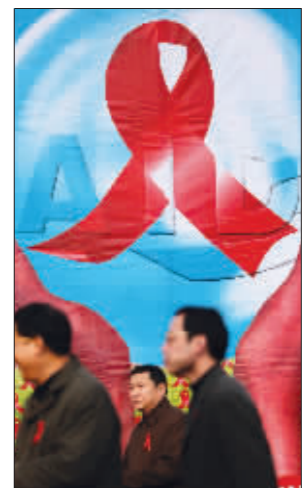
昨天，鼓楼广场竖起巨大的防艾宣传画。