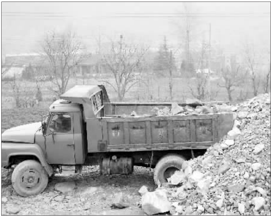
离校仅百余米的山坡上密布铝矿

据了解,陕县第三实验学校原为义马煤业集团观音堂煤矿子弟学校,一年前归属陕县,但校址没有迁移。这里属山区与丘陵交错地带,地下富藏煤炭和铝矿资源,1905年,此处就有了煤矿,现在,煤矿和铝矿业仍是当地的支柱产业。