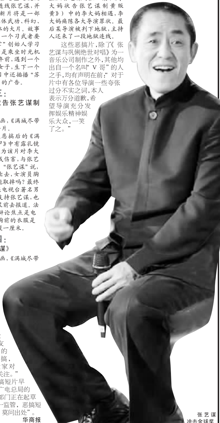
张艺谋 冲击金球奖